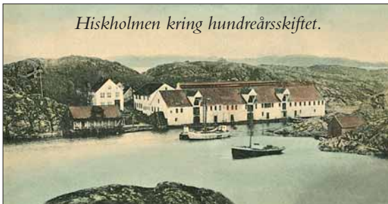
Hiskholmen kring hundreårsskiftet.

låg så sentralt i vårsildfeltet. I Baadehuset låg doktorsalen, sjefssalen og dommarsalen på rekkje, og på loftet var det losji for fiskarar som låg «floglagde» på golvet i dei store sildeperiodane. Baadehuset er i dag vakkert restaurert av det lokale husmorlaget og er oppe for vitjing etter avtale. □