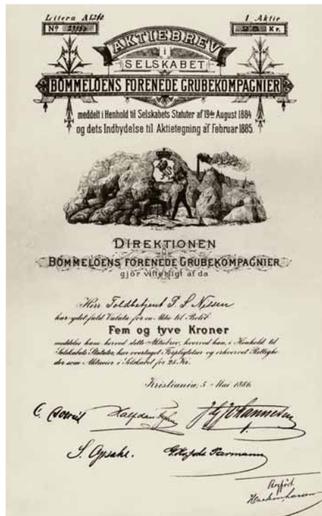
Faksimile av aksjebrev i BØMMELOENS FORENEDE GRUBEKOMPAGNIER.