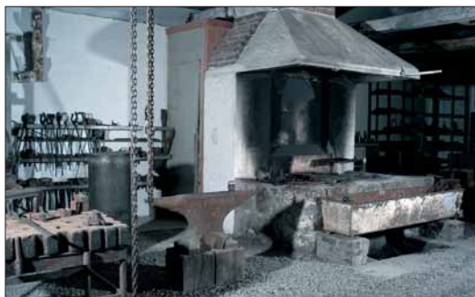
Essa i Wichman-smia var starten på heile verksemda. Det vesle «kontoret» (bak essa) var såvidt stort nok til den breidskuldra smeden.

Fabrikken har stadig ekspandert utover hundreåret og hatt mykje å seia for lokalsamfunnet. I dag er Wärtsilä Wichmann Diesel A/s ei bedrift med 300 tilsette. Motoren, Wichmann 28, vert levert til fartøy i inn- og utland. Den gamle smia, kjernen i den første industriverksemda, er flytta ut frå fabrikkområdet og restaurert som museum.