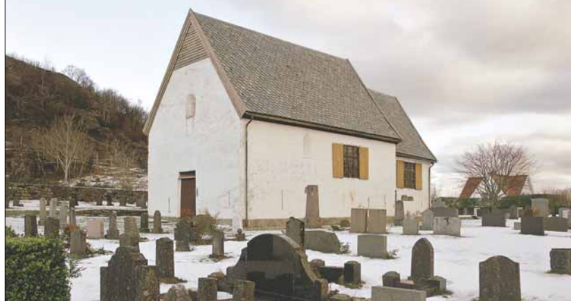
Moster gamle kyrkje frå 1100-talet.