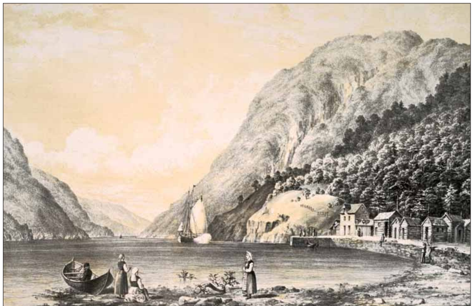
Strandstaden Eide. Litografi av M.W. Atkinson, 1852.

Granvin er samansett av gran og vin «naturleg eng». Også Hollve (ofte skrive Holven) har vin som sisteledd, her som ofte elles forkorta til -ve. Førsteleddet er gno. hallr «skrånande». Andre vin-namn er Velkje (Velken), av valk «lita pute, knute, sandbanke», og Bilde, av gno. bildr «vinkelforma, skjerande reiskap, pil», med bakgrunn i terrengtilhøva. Førsteleddet i Kjerland er gno. ker «kar, fiskegjerde», medan gno. reyni «stad der det veks raun» ligg til grunn for Røynestrand (ofte skrive Røynestrand). For Taskjelle ligg kanskje eit eldre elvenamn til grunn, der -skjelle kan setjast i samband med gno. skella «smella, larma». Skjervet er laga av skjerv «skarv, nake skjer».