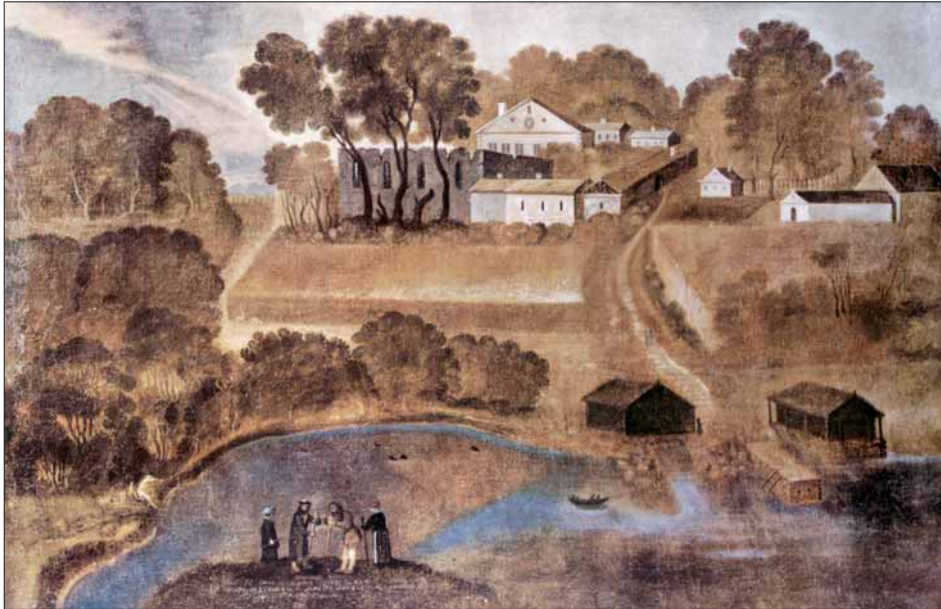
Av Elias Fiigenschougs måleri frå 1656 ser vi korleis anlegget då såg ut; mange av mellomalderbygningane stod framleis.

HALSNØY KLOSTER ligg midt i det frodige fjordlandskapet i Sunnhordland, på eitt av dei låge eida, eller 'balsane' som har gjeve øya namn. Slake bøar skrånar ned mot sjøen på begge sider; i sør mot Klosterfjorden, i nord mot den lune Klostervågen.