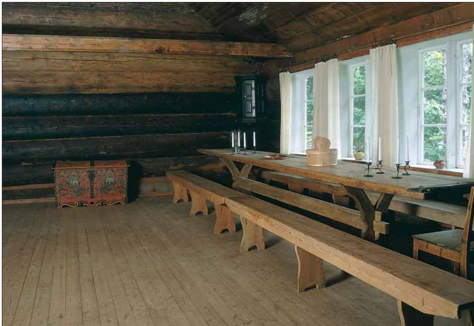
Jåstadstova står i dag ved Hardanger folkehøgskule på Lofthus.