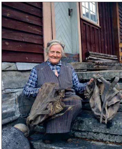
Med dei gamle postsekkene i tunet på Tvinne.