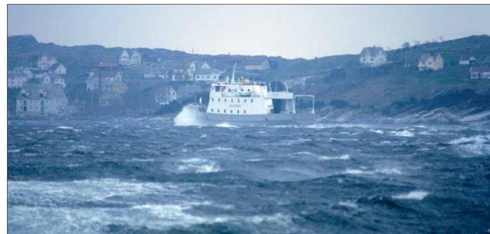
M/F SKJERGAR trafikkerte ferjeruta mellom Rong og Solsvik fram til Øygardsvegen og brua over Rongesund stod ferdig i 1986.

Men trass i dårlege tider og nådelaus fraktkrig i forsøk på å ta knekken på konkurrenten og sjølv overleva, vart mellomkrigstida ein periode med mange nyvinningar i samferdsle. I denne perioden byrja samspelet mellom ferdsla på sjø og land å finna si form. Sysselsetjingsarbeidet i 1920-åra resulterte i at ei rekkje vegar vart bygde. Den vesle vegstubben som gjekk ned til dampskipskaien vart fleire og fleire stader strekt ut langs fjorden og knytt saman med andre vegstubbar og dampskipskaia. Slik vart bygder og kommunar bundne i hop. Bilane følgde etter. Dei første regulære bilrutene vart sette opp like mykje med tanke på turistar som på vanlege ferdafolk. Typisk nok vart nye turistbåtruter i Hardanger tidleg i 1920-åra sette opp i korrespondanse med lokale bilruter.