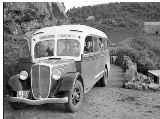
Ferja mellom Alvøen og Brattholmen korresponderte med rutebil til Møvik. I 1971 avløyste Sotrabraua denne ferjeruta.

I 1935 vart det første bilferjesambandet oppretta mellom Alvøen og Brattholmen. Fleire av dei mest trafikkerter ferjesambanda i fylket vart etablerte i åra før den andre verdskrigen: Steinestø-Isdalstø-Alverstraumen, Haus-Garnes, Kvannadal-Ålvik og Fusa-Hatvik.