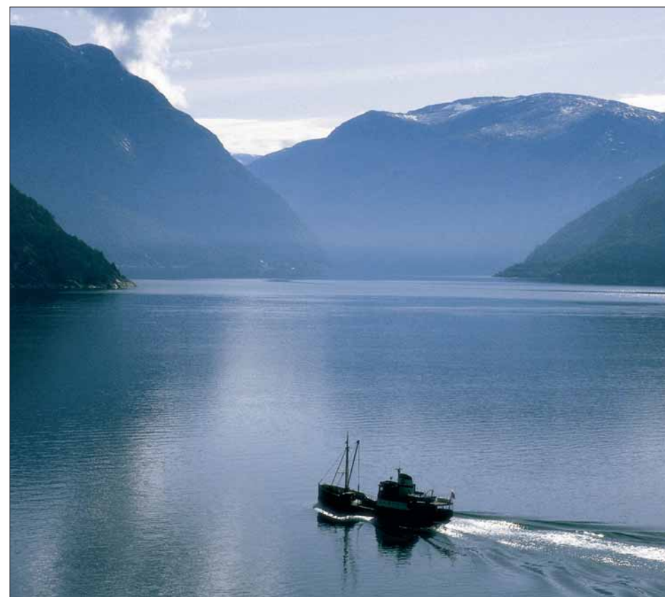
80 M/S GRANVIN, bygd i 1931, i rute på Hardangerfjorden.

særleg olje, skapte vanskar for fleire rute-lag. Gammalt materiell kom til heider att fordi dei gamle dampbåtane kunne fyrast med ved når det kneip. Tanken om jernbanesamband mellom Bergen og Os dukka opp att. I 1943 rekvirerte den tyske krigsmarinen Hatvik til ubåtbases, og all ferjetrafikk måtte innstillast. Okkupantane hadde planar om å føra ei normalspora jernbane dit, men det vart med planane.