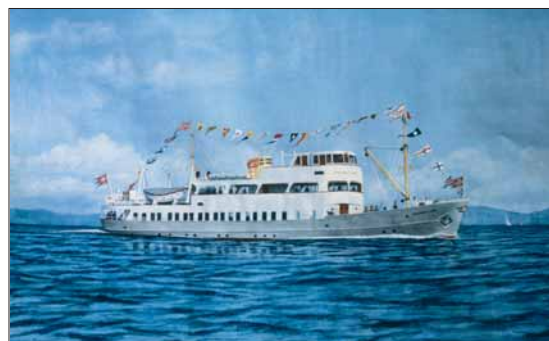
M/S MIDTHORDLAND, bygd i 1947, var ein av dei moderne «sjøbussane».

lossa snøggare. Ikkje minst viktig var det at fleire kunne bu heime og pendla til arbeidet sitt i Bergen. Etter krigen kom ein generasjon av moderne «sjøbussar»: HOSANGER I , HERNAR , MELANDDROTT , MIDTHORDLAND og mange andre.