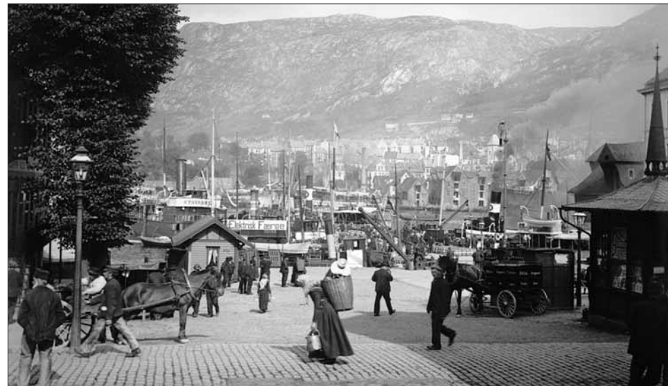
Muralmenning kring 1910.

Denne nostalgiske og lett vemodsfylte visa om den gamle dampen, arbeidshesten i samferdsla på Vestlandet sidan slutten av 1800-talet, fangar i eit glimt inn eit fengslende bilete av ei kulturform som kvarv ved kommunikasjonsrevolusjonen i etterkrigstida. Visa er skriven då D/S OSTER, som ein av dei siste fjordabåtane i rutefart i Nordhordland, vart teken ut or drift i slutten av 50-åra. Då var ein epoke over: Fjordabåtane på rekkje og rad langs Bryggen og Strandkaien, lasta med jordbruksprodukt og byvarer, strilar og byfolk: OSTER, HAUS, HAMRE, JOHAN JEBSEN, ALVERSUND, MELANDDROTT, ØYGAR, VØRINGEN, STORD og mange andre. Alle norske kystbyar hadde sin lokalskipsflåte. Men ingen kunne måla seg med den armadaen som