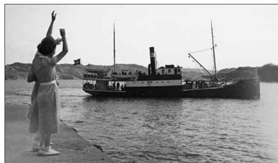
«Dampen» gjeng frå Hernar.