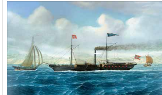
Hjuldampskipet PATRIOT, ein av pionerane i dampskipsfarten på Vestlandet, var bygt i Hamburg i 1836. Båten kom i fart til Sogn og Hardanger i 1854.

Slik ser vi at samferdsla til sjøs stort sett var uendra i Hordaland frå 1880-åra og om lag femti år framover. Denne epoken er glanstida for fjordabåten. Dei få vegane som fanst, knytte bygdelag og dampskipskai i saman. Mellom bygdene var det sjeldan veg. All samferdsle og transport gjekk sjøvegen.