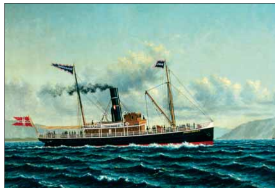
D/S JOHAN JEBSEN, som vart bygd i 1894 for Indre Nordhordland Dampskibsselskab, vart seld i 1951.