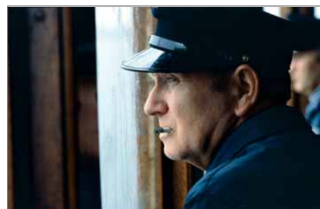
I styrehuset på M/F VESTGAR.

Krigen førte til vilkårleg rekvirering av transportmiddel. Fleire av fjordabåtane vart tekne av okkupasjonsmakta og sette i tysk teneste. Rasjonering av drivstoff,