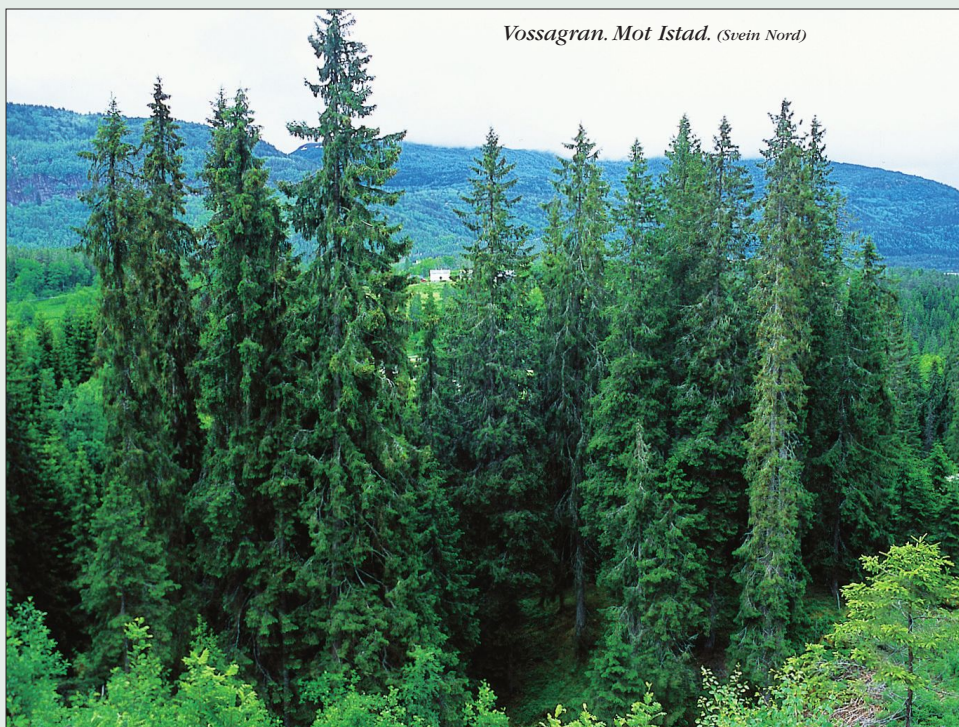
Vossagran. Mot Istad. (Svein Nord)

Voss – det bar truleg samanheng med den naturlege granskogen. Austpå er dette den vanlegaste bakkespetten, men på Vestlandet er andre artar meir typiske. (Roar Solheim)