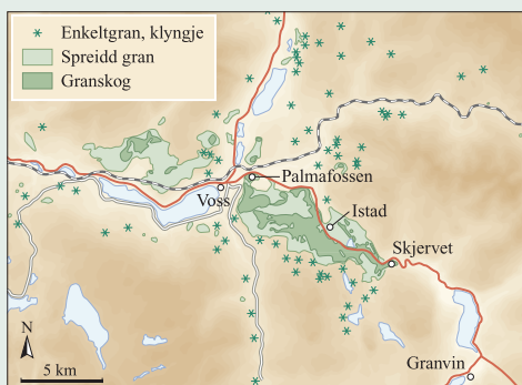
Førekomstar av naturleg gran i Voss.

(Knut Nedkvitne/H.P. Thonter/Eva Bjørseth)